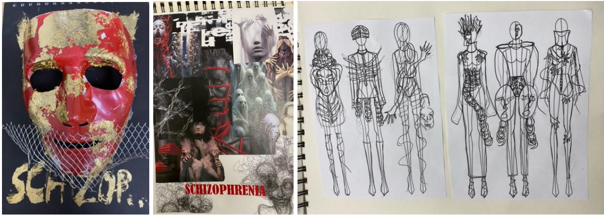
1 pav. D.Deveiktės idėjos ir modeliai, 2023 m.