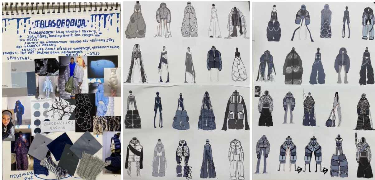
2 pav. P.Vituskaitės baigiamasis darbas, 2023 m.