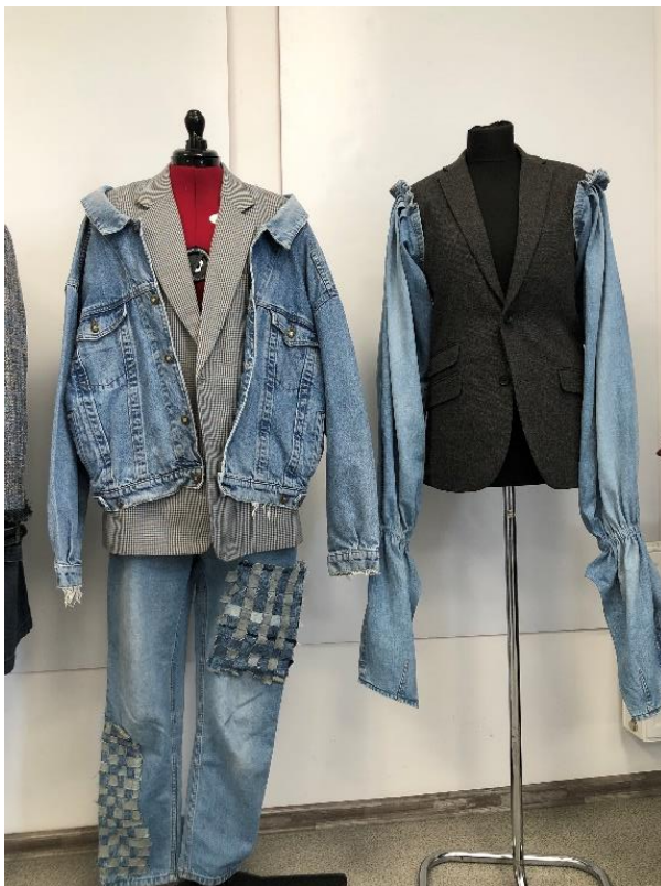
3 pav. L. Motiejauskaitės, M. Kleizaitės modeliai, 2022m.