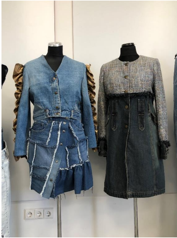
1 pav. N. Dubosaitės, E. Kamarauskienės modeliai, 2022 m.