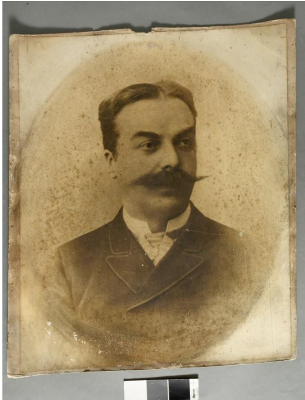
1 pav. Nežinomas autorius. M. Oginskio portreto fotografija prieš konservavimą, popierius, fotografija, 63 x 51 cm 2022 m.