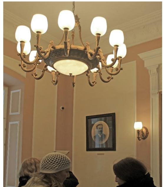
4 pav. M. Oginskio portreto kopija Plungės kunigaikščių Oginskių dvaro rūmuose. 2022 m.