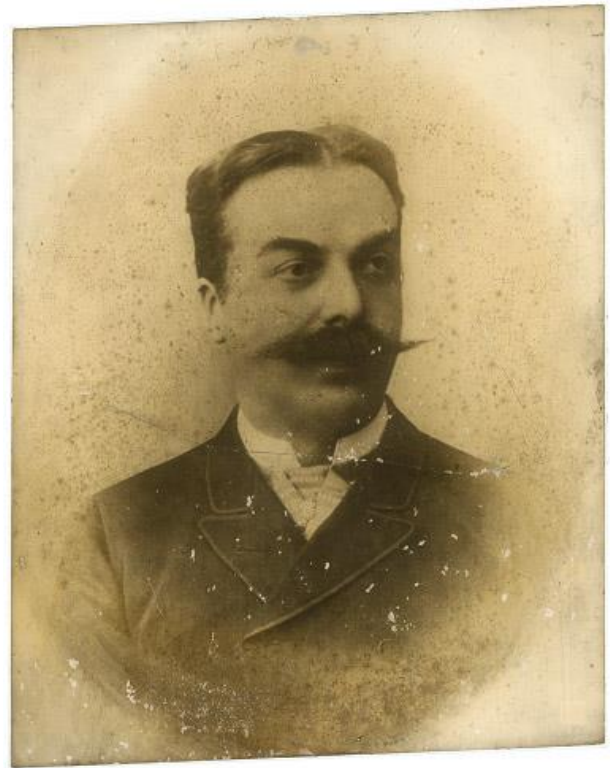
2 pav. M. Oginskio portreto fotografija po konservavimo. 2022 m.