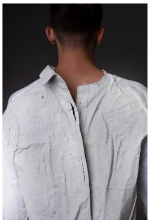
7 pav. Stereotipo „Etikečių baimė“ vizualas