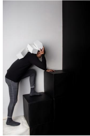
5 pav. Stereotipo „Nenoras pasirodyti silpnu ir pažeidžiamu arba pripažinti, jog reikalinga pagalba“ vizualas