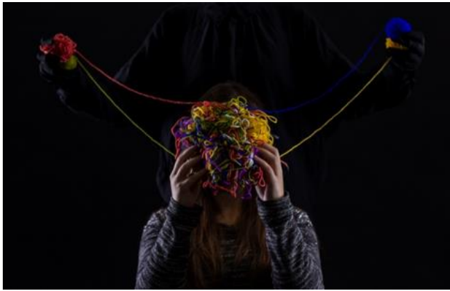
1 pav. Stereotipo „Gydymo(si) baimė – nuomonė, jog šnekėjimas nieko nepakeis“ vizualas