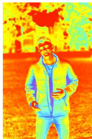
9 pav. Stereotipo – „Sutrikimų turintys žmonės yra pavojingi ir neprognozuojami“ vizualas