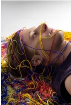
3 pav. Stereotipo „Gydymo(si) baimė – nuomonė, jog šnekėjimas nieko nepakeis“ vizualas