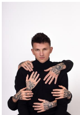
8 pav. Stereotipo „Etikečių baimė“ vizualas