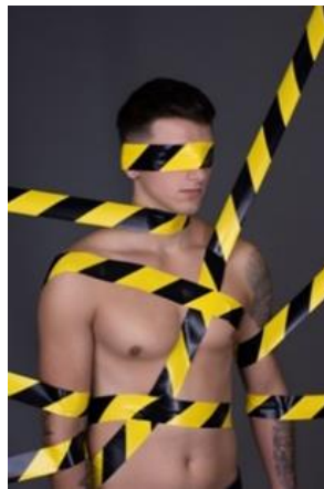
4 pav. Stereotipo „Gėdos jausmas (aš turiu problemų, o kiti – ne)“ vizualas