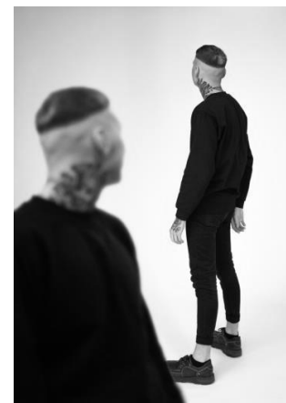
10 pav. Stereotipo „Sutrikimų turintys žmonės yra pavojingi ir neprognozuojami“ vizualas