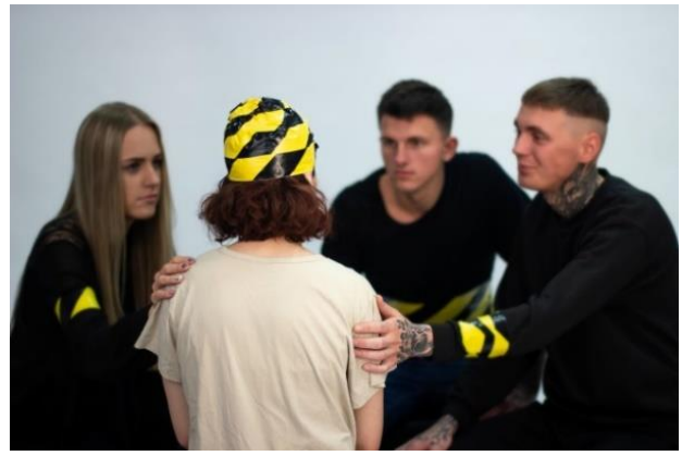
2 pav. Stereotipo „Gėdos jausmas (aš turiu problemų, o kiti - ne)“ vizualas