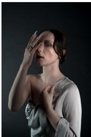
2 pav. Netark Dievo vardo be reikalo