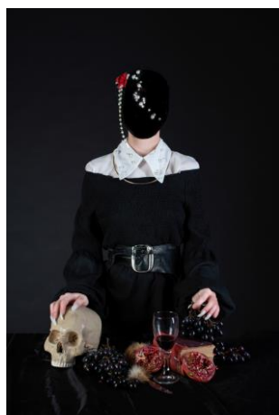
5 pav. Nežudyk