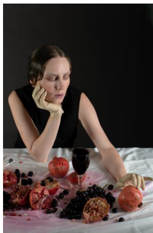
3 pav. Švęsk sekmadienį