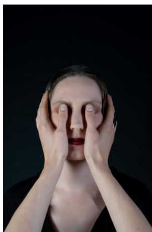
9 pav. Negeisk svetimo vyro ir svetimos moters