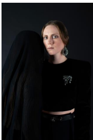
8 pav. Nekalbėk netiesos