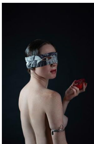
6 pav. Nepaleistuvauk