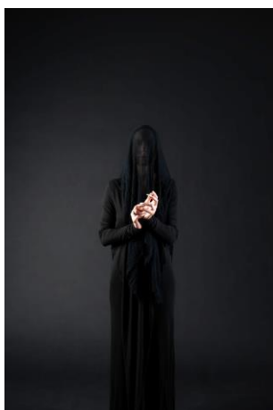
7 pav. Nevok